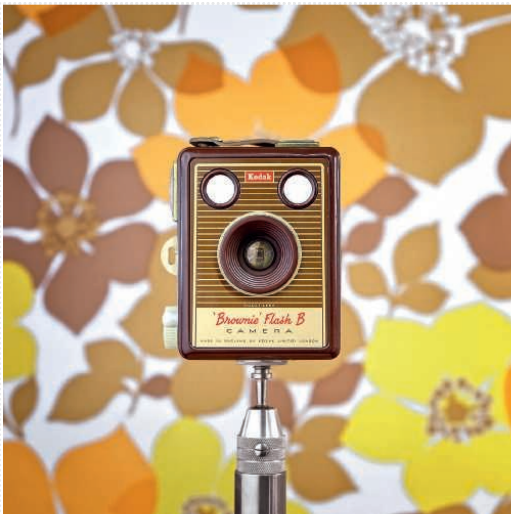
← CameraSelfie n°58-Brownie Flash.